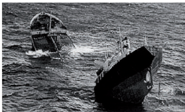
Fig. 1.1 The oil tanker Prestige suffered catastrophic mid-ship structural failure off the Spanish coast during bad weather in November 2002, causing a major environmentally disastrous hydrocarbon discharge of most of its 70,000 tonnes of heavy fuel oil cargo.

Il trasporto su acqua è la forma di trasporto merci più conveniente in tutto il mondo. L'industria marittima è vitale per l'economia europea e occupa più di 2 milioni di persone nel settore delle costruzioni e nel campo mercantile. L'Europa detiene il 38.5 % dell'intera flotta navale mondiale.