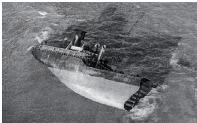
Fig. 1.2 Maltese tanker, Erika, broken in two during severe weather in the Bay of Biscay in 1999. 20,000 tonnes of heavy oil was discharged much of which ended up on the beaches of Brittany.